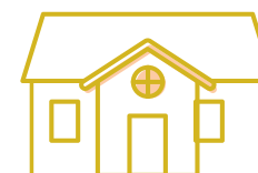
Ikke fredet bygning udenfor kirkegård

Find vejledningen på Den Digitale Arbejdsplads under fanen "Håndbøger" og i feltet "Bygninger og arealer".