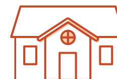
Fredet bygning udenfor kirkegård

Menighedsrådet kan selv tage stilling til en række ting, se bagsiden.